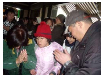
『良い年でありますように！』

1/9 法多山に初詣。今年1年の安全や、健康祈願に行きました。参加者は、それぞれに色々な思いを胸にお賽銭を投げ、手を合わせていました。愛野駅から法多山までは中々の道のりの上、本殿までは急な階段が続きます。上を見上げた時は「本当に登れるのかなか〜？」と心配でしたが、全員元気に本殿に辿り着きました。お父さん、お母さんへのお土産の厄除け団子をしっかりと抱え、無事に帰って来ました。デイサービスには、いつも沢山のご応募を頂き