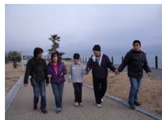
公園で遊びました♪♪

12/29・30の2日間“冬期デイサービス”を行いました。1日目は、谷口原の中条さん像までハイキング。強風の中、みんな頑張って歩きました。2日目は、用宗の広野海洋公園へバス遠足。広々とした公園に解放され、寒さを忘れ思う存分に遊んで来ました。みんな、とても良い表情をしていましたが、さすがに疲れたのか帰りのバスの中ではスヤスヤと眠る、可愛い寝顔が見られました。