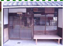
会場の荷縄屋です♪

日程：平成24年1月15日(日)、2月19日(日) 1時～4時 / 会場：島田市河原町 荷縄屋