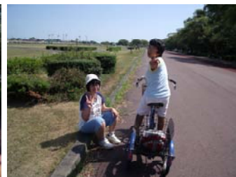
交代で乗ったよ♪ピース♪