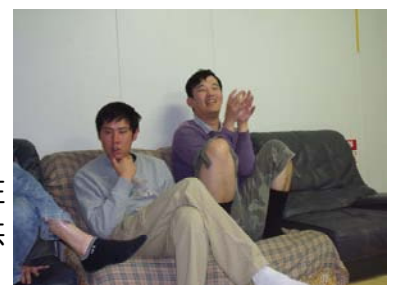
帰宅後は、ゆっくり過ごします